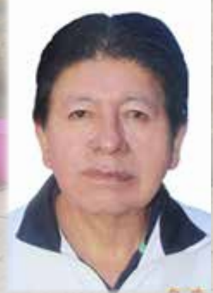
FAUNA URBANA Milton Arquiñego